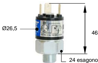
Esecuzione con connessione elettrica P3 Execution with P3 electric connection