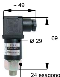
Esecuzione con connessione elettrica M3 Execution with M3 electric connection